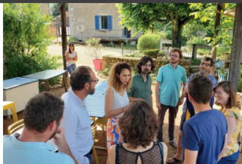
Formation accompagnateurs BDBFC

Terragilis reste à disposition de l'équipe projet tout au long de l'opération.