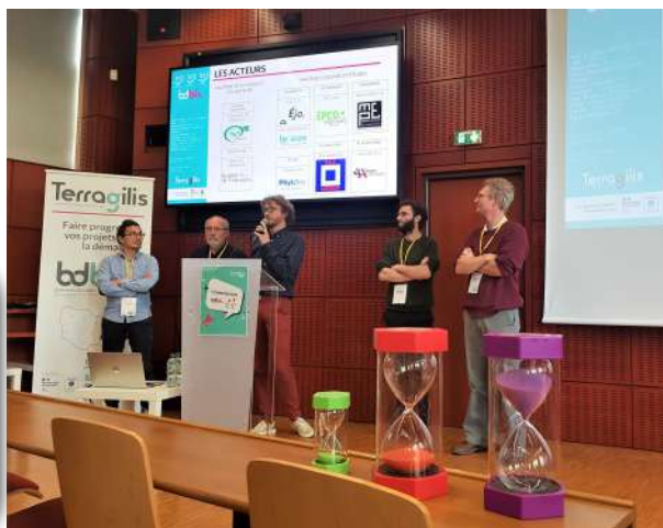
Commission d'évaluation BDBFC - 27/04/2023 - Chalonsur-Saône